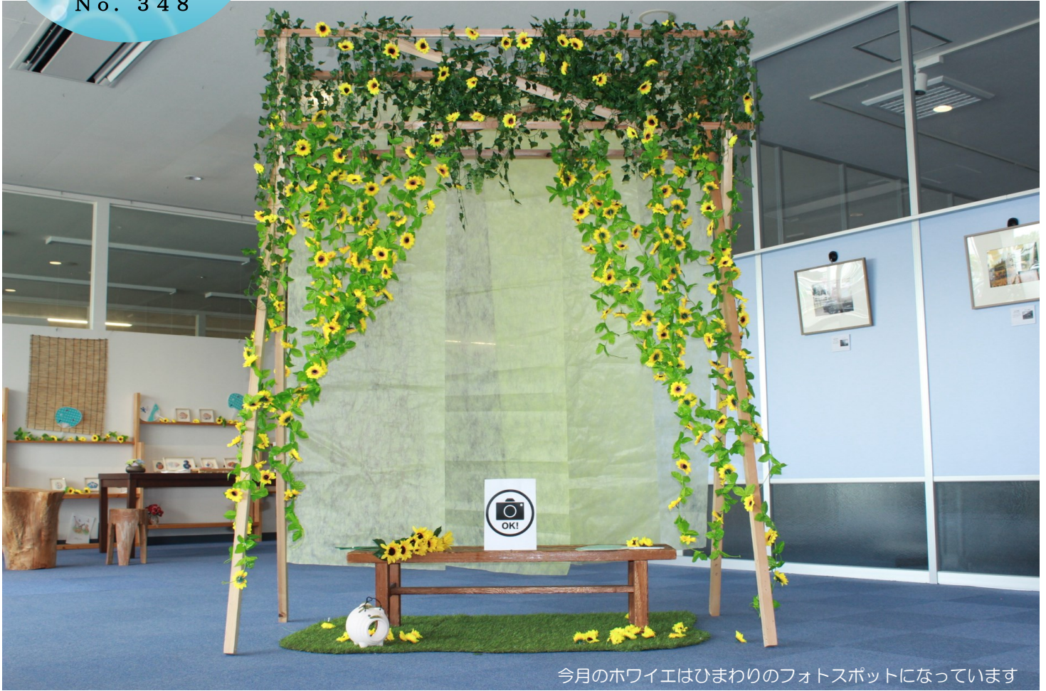
今月のホワイエはひまわりのフォトスポットになっています